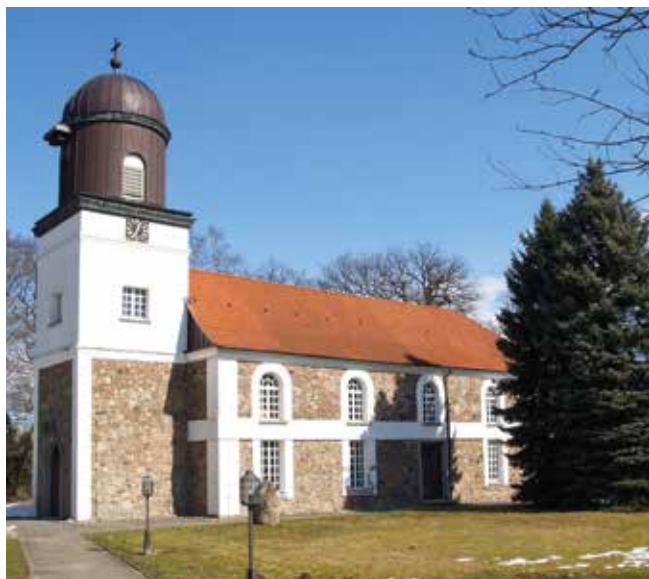
Kirche in Gülzow

Zuständig für die Gemeinden Grabau und Grove Kirchenbüro: Markt 5 b 21493 Schwarzenbek 04151 89230 www.kirche-schwarzenbek.de