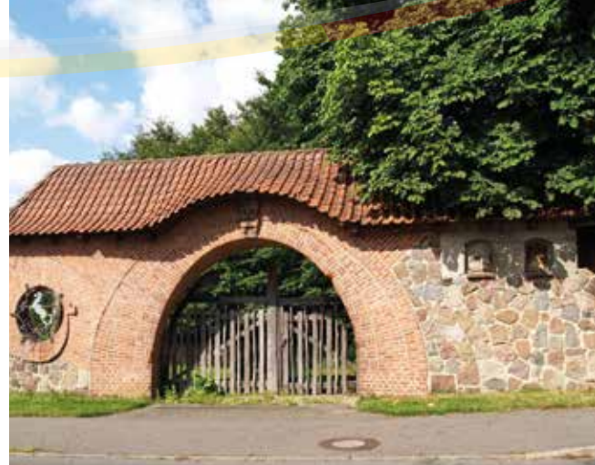
Tor in Gülzow

Grove hat etwa 270 Einwohnerinnen und Einwohner und liegt nur ca. drei Kilometer nördlich von Schwarzenbek, dessen Infrastruktur gerne von den Bürgerinnen und Bürgern genutzt wird. Da man vom Durchgangsverkehr weitestgehend verschont bleibt, lebt es sich sehr ruhig in Grove. Gleichzeitig benötigt man durch die Nähe zu